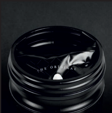
1. DECKEL ABNEHMEN