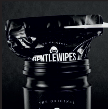
2. ENTNEHMEN SIE DEN BEUTEL UND KNETEN DIESEN EIN WENIG DURCH. ANSCHLIESSEND SCHWEISNAHT MIT EINER SCHERE ODER HÄNDISCH AN DER ABRISSEKANTE ENTFERNEN