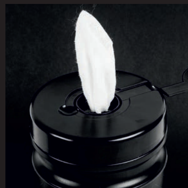
6. LET'S CLEAN YOUR VEHICLE