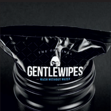
2. INTEGRIERTEN ZIP-VERSCHLUSS LUFTDICHT ZUSAMMENDRÜCKEN (DARAUFGAUCHEN, DASS DER VERSCHLUSS KORREKT VERSCHLOSSEN IST)