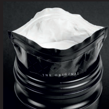
3. BEUTEL ÖFFNEN