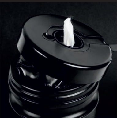
5. TUCHSPITZE DURCH DIE ÖFFNUNG DES DECKELS DRÜCKEN