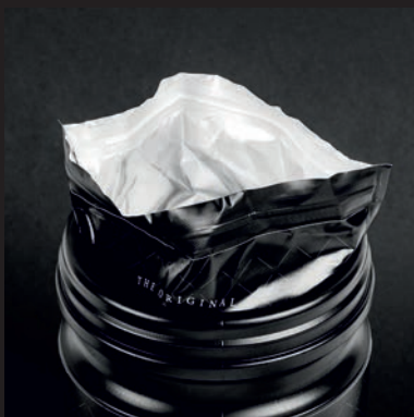
1. DECKEL ABNEHMEN UND EIN WENIG AUS DER DOSE HEBEN