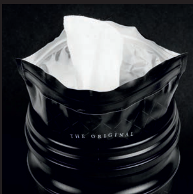
4. AUS DER MITTE DER TUCHROLLE - MIT DEN FINGERSPITZEN - DAS ERSTE TUCH NACH OBEN HIN ZIEHEN